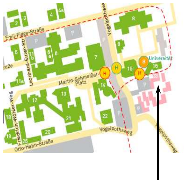
Campus – Treff (Nr. 23)